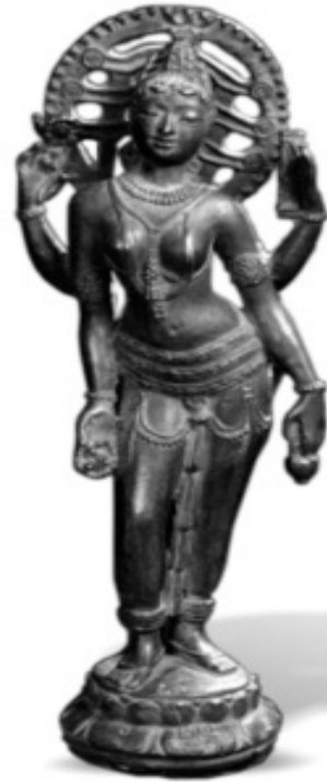
वाग्देवी पुरस्कार प्रतीक